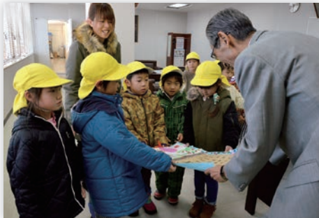
本店を訪問し、カレンダーを手渡す大坊保育園らいおん組のおともだち