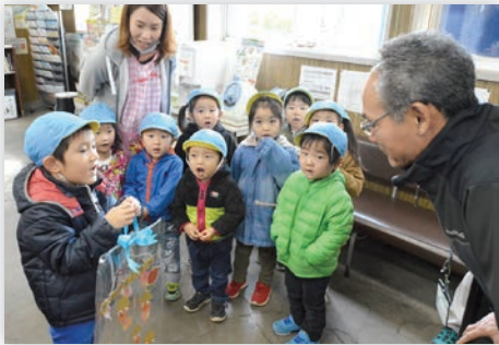
竹館支店を訪問し、壁掛けを手渡すからたけこども園りす組のおともだち

園児は、手づくりのプレゼントを手渡し、「お仕事ご苦労さまです！」と元気にあいさつした。