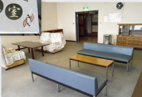
自由に使用できる交流室