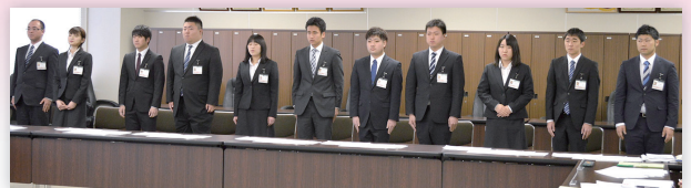
自己紹介する新採用職員

新採用職員は3月下旬、J A青森中央会主催の研修会に参加し、社会人としてのマナーやJ Aの仕事、農業情勢などを学んだ。入組式後、それぞれの職場に配属され、早速業務を行った。