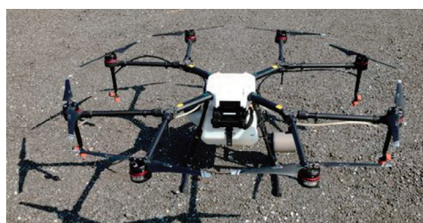
MG-1S (10ℓ / 10kg)