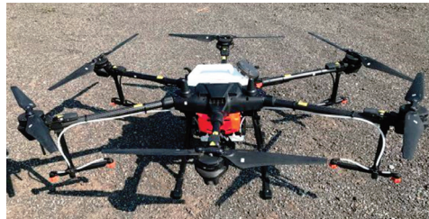
T20 (16ℓ / 16kg)