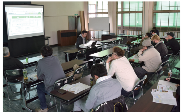
「節水型乾田直播栽培」について学ぶ参加者

研修会では、株式会社NEWGREENの社員が講師を務め、節水型栽培の基本的な栽培体系や成功のポイント、メリット、注意点などを説明。参加者は、施肥や水の管理、薬剤散布などを確認しました。