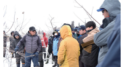
講師の説明を聞く参加者